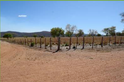
Cercas na parte grilada do Território da Comunidade Quilombola Kaágados