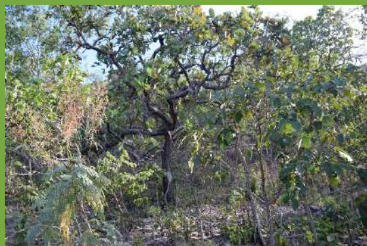
Vegetação de Cerrado na Serra da Comunidade Quilombola Kaágados