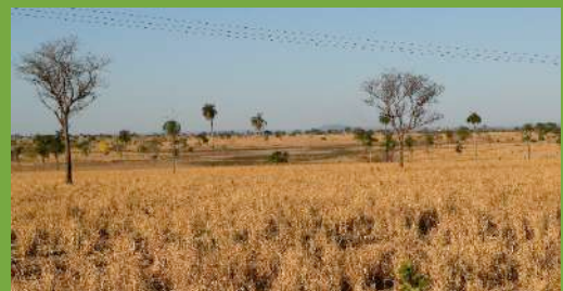
Cascaiera – área alagada destruída pelo desmatamento

“ Desmatou, tinha a mata de reserva, que tinha aí eles acabaram quela todinha, Aroeira, Ipê, Jatobá, derrubou tudo. O rio tinha, o rio não secava não, o rio hoje não tem mais água, o da Almesca a água já não corre mais, já tá criando lodo, vai secar. Eles desmataram tudo isso, acabou com a água. Acabou, nois tamo sem água, em vista do que era,