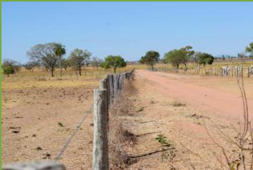
Estradas e cercas na parte grilada do Território da Comunidade Quilombola Kaágados