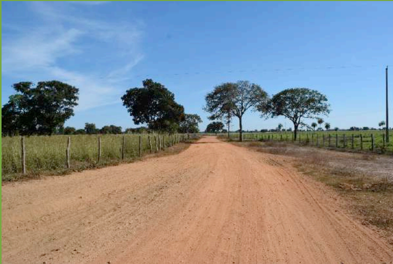
Estradas e cercas na parte grilada do Território da Comunidade Quilombola Kaágados

“ Uai, chegava mandava retirar da casa, eles dava um prazo de tantos dias pra o povo saí, senão vinha e empurrava, empurra com trator, aqui empurrou umas duas. Casa de meu irmão, casa de uma sobrinha minha, uma da minha irmã, foi tudo pro chão.