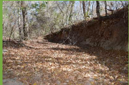
Leito do rio Kaágados seco

“ Desmatou, tinha a mata de reserva, que tinha aí eles acabaram quela todinha, Aroeira, Ipê, Jatobá, derrubou tudo. O rio tinha, o rio não secava não, o rio hoje não tem mais água, o da Almesca a água já não corre mais, já tá criando lodo, vai secar. Eles desmataram tudo isso, acabou com a água. Acabou, nois tamo sem água, em vista do que era,