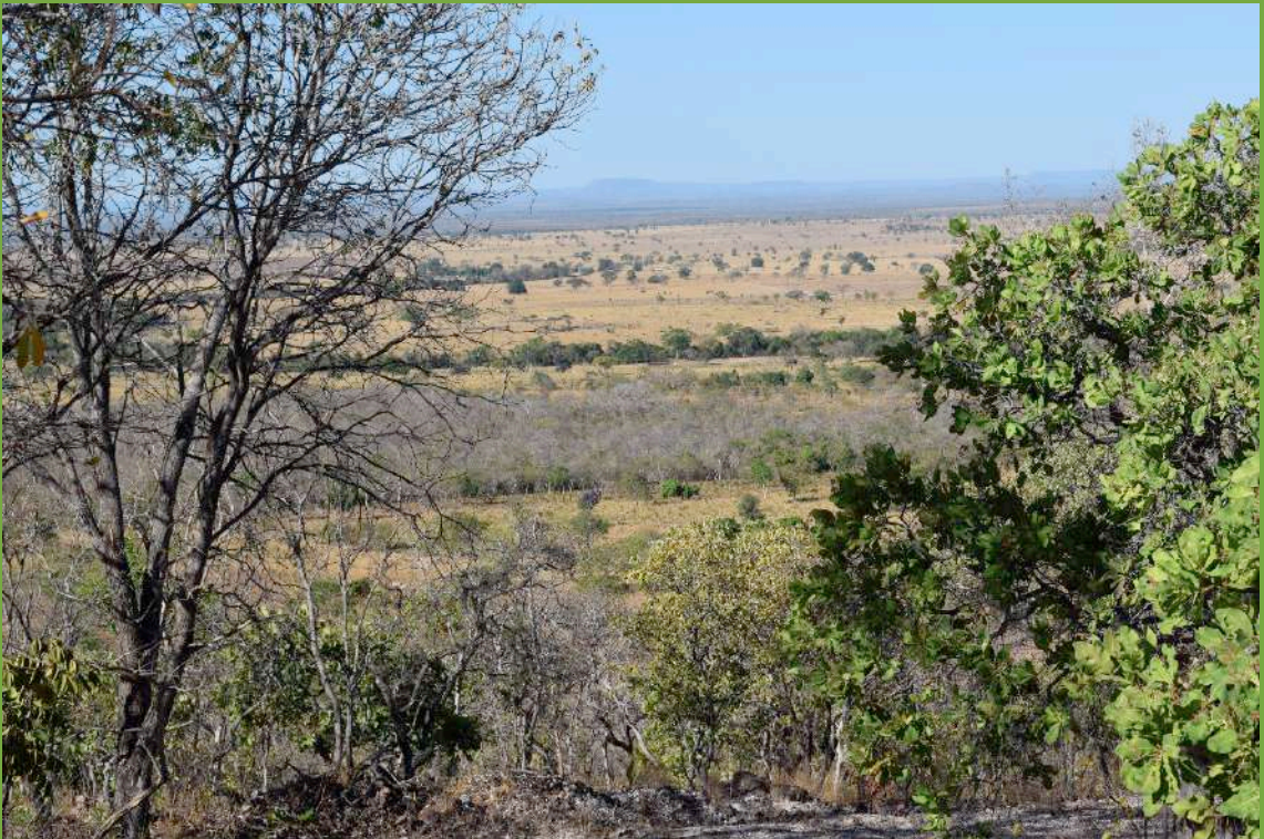
Vista geral do território da Comunidade Quilombola kaágados

Na região sudeste do Estado do Tocantins inicia-se a exploração do ouro por volta de 1700. Chega nesse período à região um grande número de Africanos escravizados para trabalharem na mineração. Muitos destes Africanos fogem da escravidão e criam um grande número de quilombos na região. Em 1734 é fundada a cidade de Arraias. Os quilombolas produzem e comercializam seus produtos, consolidando-se. Como resultado desse processo de escravidão e rebeldia, com a consolidação dos quilombos, temos hoje no município, segundo o Censo do IBGE de 2010, uma população de 88,52% de pretos e pardos. A Comunidade Quilombola Kaágados aí localizada, embora tenha consolidada, vem sofrendo a invasão do seu território tradicional há muitas décadas. Entre os anos de 2016 e 2017 foram realizadas oficinas de mapas e sucessivas reuniões com integrantes da Comunidade Quilombola Kaágados. Esse diálogo possibilitou a elaboração deste fascículo.