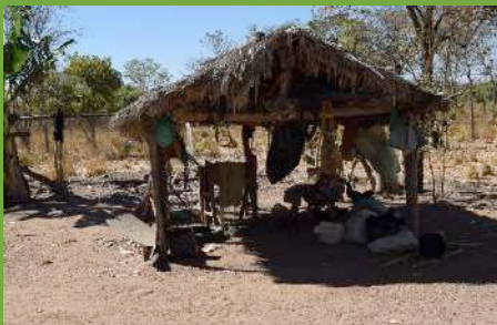
Barracão e equipamentos de trabalho