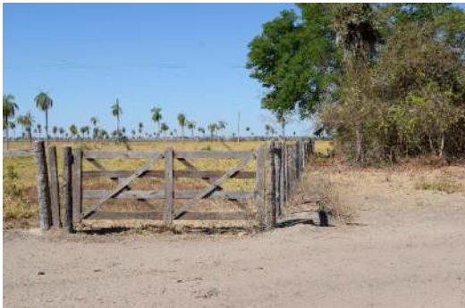
Território da Comunidade Quilombola Kaágados grilada e cercada

“ A gente conhecia eles aqui por outras fazendas, mas por aqui eles não existia não, lá pro município de Arraias, pra lá o território deles, pra lá. Ah, eles começou a entrar nas terras nossas parece que foi em cinquenta, é eu acho que foi em cinquenta e sete. Então o trem começou foi assim ó, eles saiu mentindo que tava