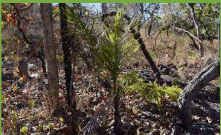
Gueroba – planta utilizada para extrativismo de palmito