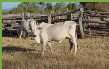
Criação de gado