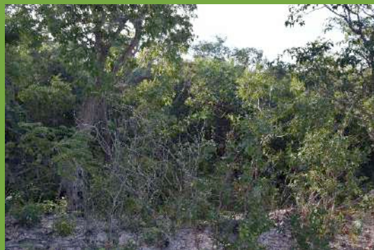
Mata da Comunidade Quilombola Kaágados