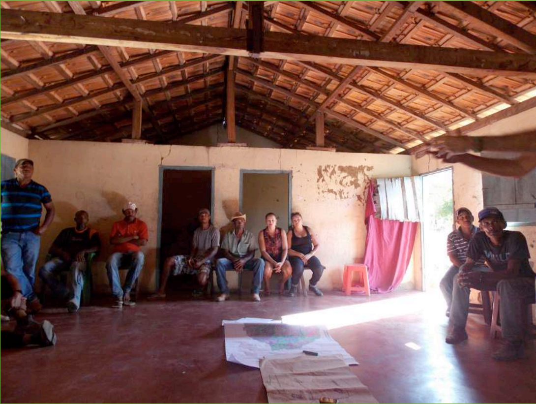
Oficina de cartografia social