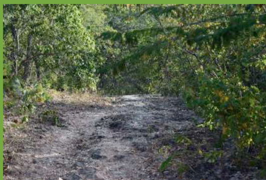
Serra da Comunidade Quilombola Kaágados