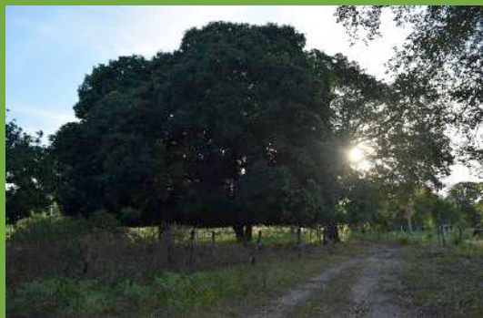
Quintal na Comunidade Quilombola Kaágados